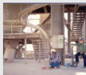
Desentupimento de ciclones