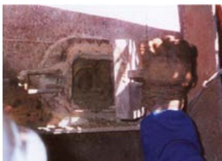
Antes do Sistema Cardox