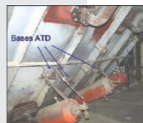
Rampa do forno