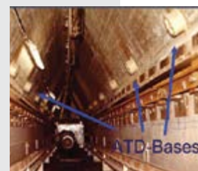
Saída do silo