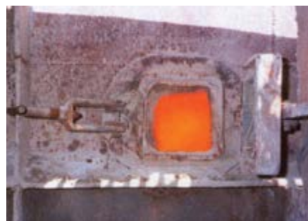
Depois do Sistema Cardox