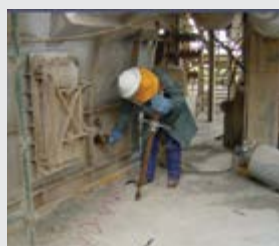
Duto de ascensão